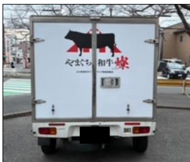
保冷車のロゴ掲載