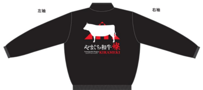
帽子・ジャンパー