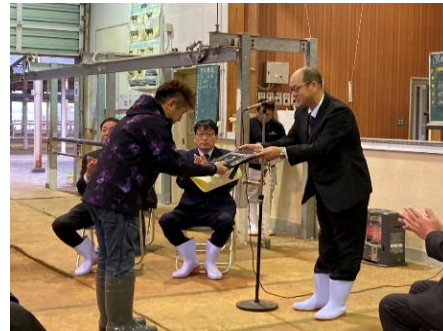
褒賞授与式風景(山口中央家畜市場)